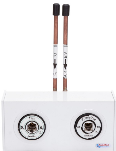
Панель відбору DIN для 2 газів