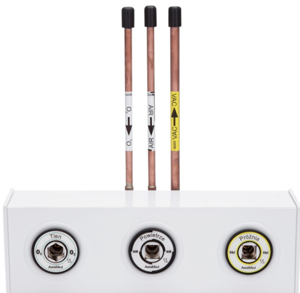
Панель відбору DIN для 3 газів