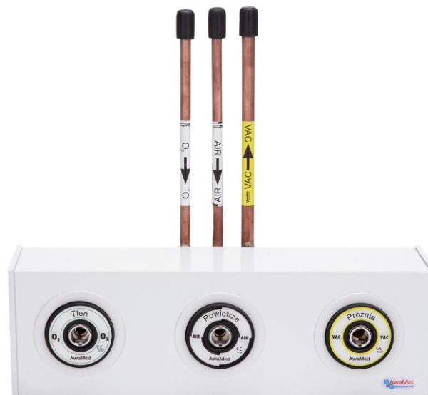
Панель відбору AGA для 3 газів