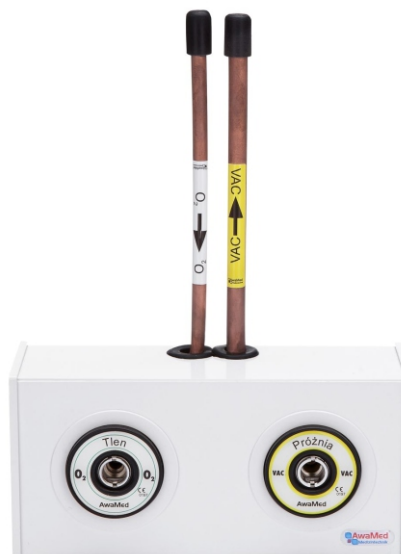
Панель відбору AGA для 2 газів