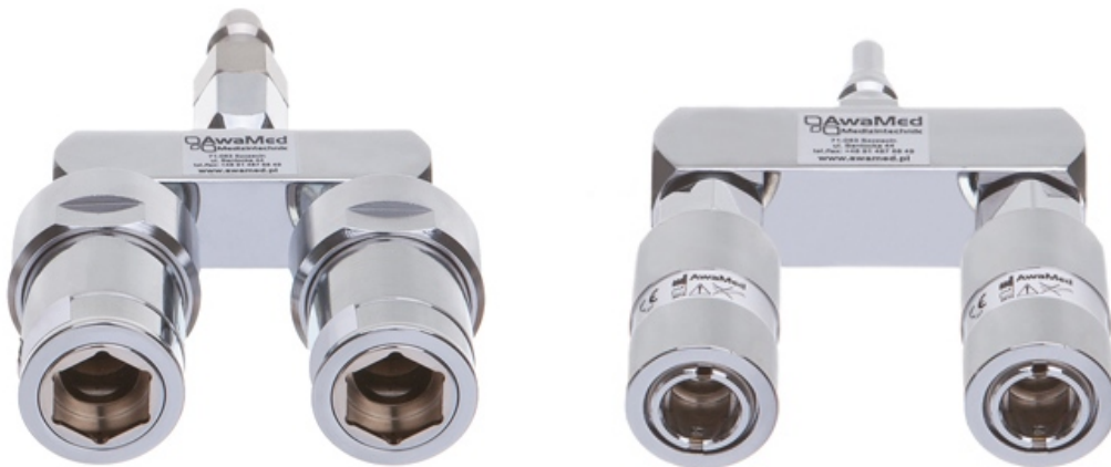
rozwężnik wersja U