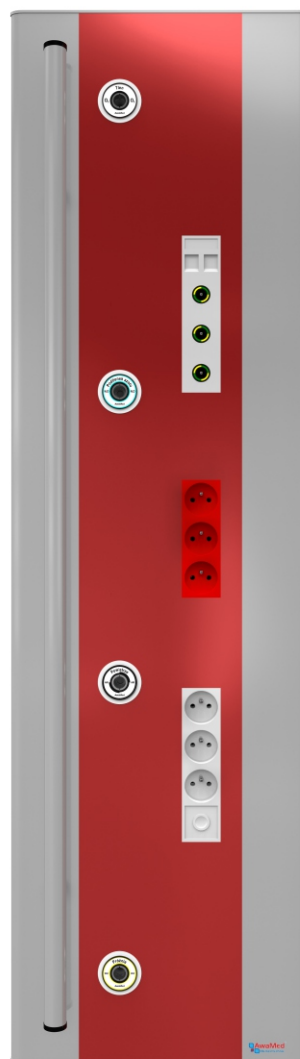
канал D канал C канал B канал A